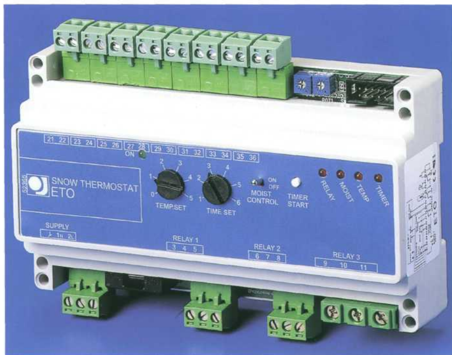
Regulator ETO kontrolujący temperaturę i wilgotność

Zmienna moc i samoregulacja powoduje, że w każdym miejscu rurociągu ciepłej wody jest stała temperatura 45, 55 lub 60 °C. Przewód grzewczy montuje się na jednym rurociągu (nie ma rury cyrkulacyj-