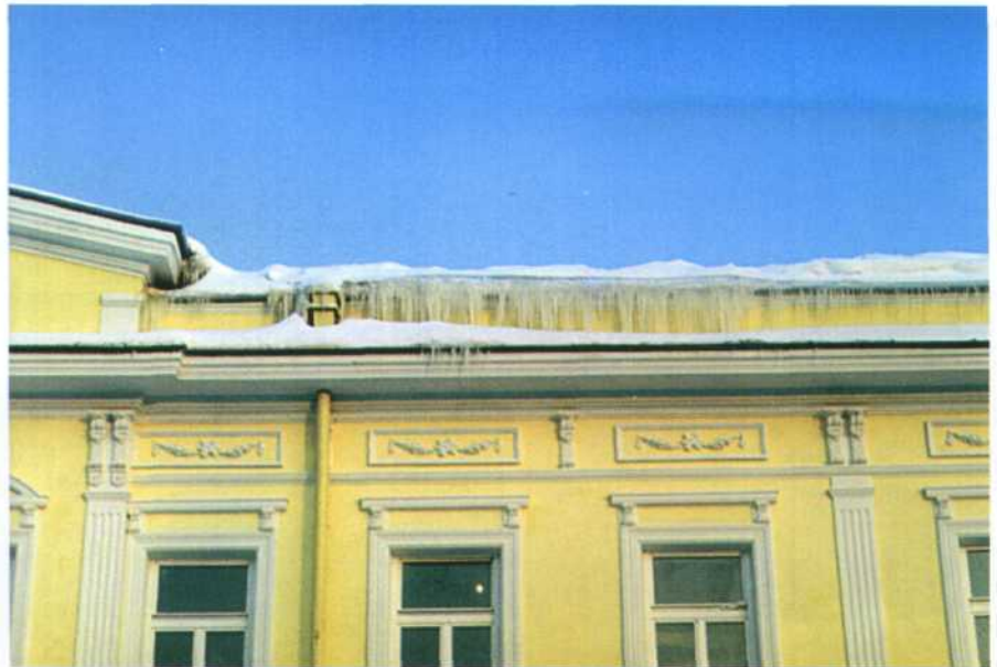
Przykład zamarzniętych rynien

wód zmienia moc w sposób automatyczny i może pracować nawet bez termostatu (stąd kable inteligentne). Samoograniczenie mocy ma szczególne znaczenie w przy-