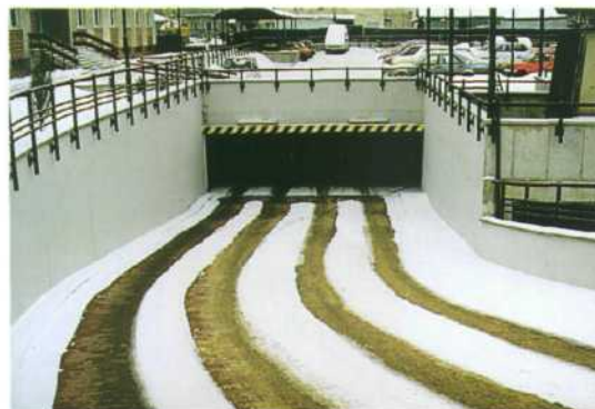
Widok podjazdu z kablami grzewczymi w ziemi