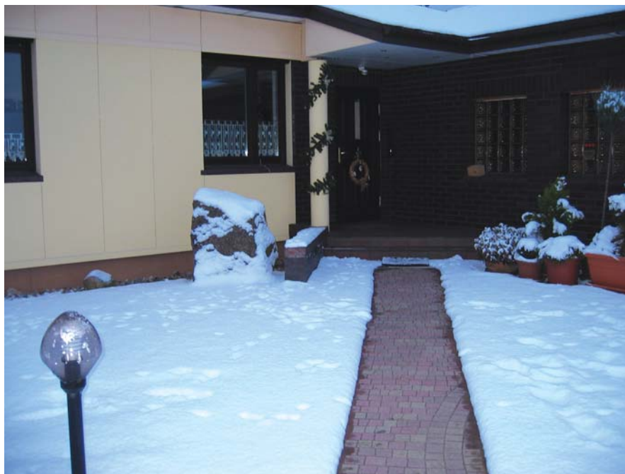
Rys. 1. Chodnik z zamontowanym systemem przeciwooblodzeniowym prowadzący do domu

Zmniejszanie wartości mocy daje pozorne oszczędności w zużyciu energii elektrycznej (system o mniejszej mocy pracuje dłużej i zużywa więcej energii). Użytkownik powinien ograniczać zużycie energii poprzez zastosowanie odpowiedniego systemu sterowania lub lokalizacji elemen-